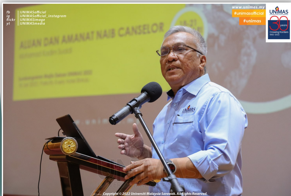
YBhg Naib Canselor menyampaikan Amanat di Sumbangsaran Majlis Dekan 2021

Kota Samarahan : Acara tahunan Sumbangsaran Majlis Dekan 2021 telah berlangsung pada 18-21 Januari 2022 bertempat di sebuah hotel terkemuka di Bandar Bintulu setelah tertangguh kira-kira sebulan. Seramai 85 orang Pegawai Pengurusan Tertinggi Universiti, Dekan, Pengarah, Presiden Peratuan dan Kesatuan serta wakil Majlis Perwakilan Pelajar turut serta.