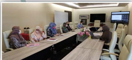
Mesyuarat PPMC dijalankan secara atas talian bersama KPT

Bajet Berasaskan Outcome (OBB) meliputi perancangan, penyediaan bajet, pemantauan dan penilaian serta pelaporan keberhasilan.