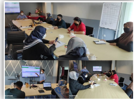
Sesi Pemurnian Data & Bahan Bukti SETARA 2022

Selain itu, sesi auditan dalaman SETARA 2022 oleh auditor yang dilantik juga telah dijalankan pada 12-14 April 2022. Auditor yang dilantik terdiri dari wakil PTJ yang telah mengemukakan data dan bahan bukti antaranya Pej Bendahari, PPPA, BPPs, UHSB, RIEC, UBS, CGS, USC dan UniC.