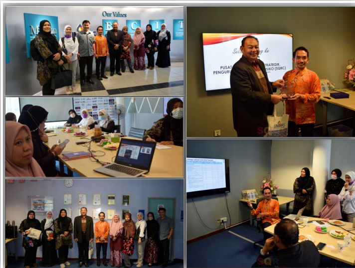
Delegasi PPSKR UTeM di SQRC