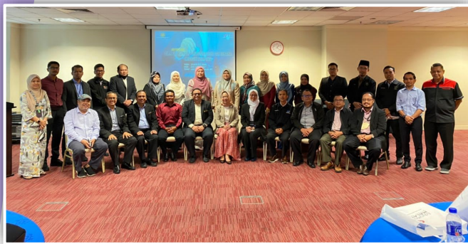
Wakil-wakil IPTA di Sesi Libat Urus Pengurusan Risiko dan Bencana

Ini berikutan bencana banjir yang berlaku di beberapa kawasan di negara ini pada akhir 2021 telah mengakibatkan kerosakan harta benda dan kemalangan jiwa. Tidak terkecuali, beberapa UA turut terjejas.