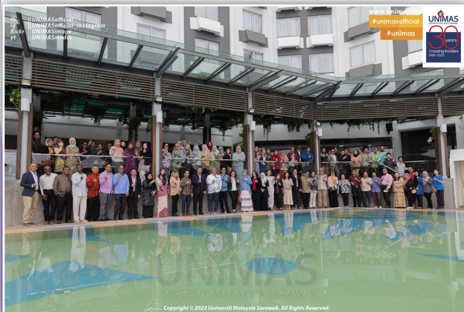
Para Peserta Bengkel Pengurusan Risiko UNIMAS