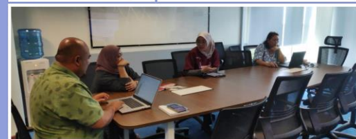
Sesi Hands on Risk Register bersama PTj (6-10 Mac 2023)