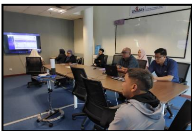
Staf SQRC mengikuti sesi demo SPeeD 2.0 secara atas talian