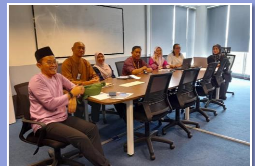
Sesi Perjumpaan SQRC bersama Pengurus Risiko PTj